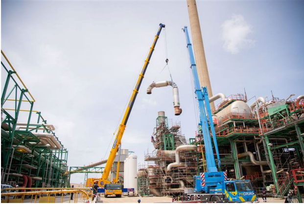
Izado del codo de la caldera de la planta de azufre U-686